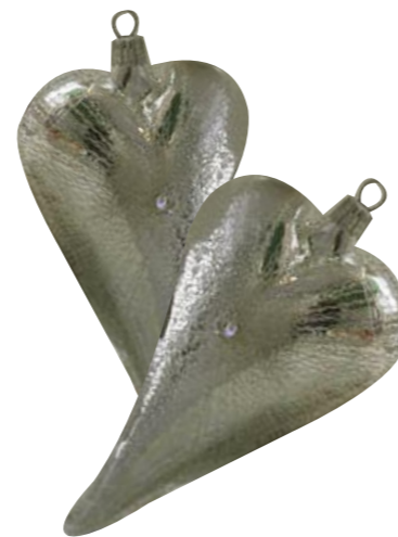
Foto oben: Geschenkpapier für Zahlen: Clou & Classic. Hirsch: Kirchner. Foto links: Blattsilber, Bouillondraht: Rayher. Kariertes Band: Halbach. Foto rechte Seite: Vase: Ikea. Große weiße Kugeln: Krebs Glas Lauscha. Übrige Kugeln, Herzen, Hirsch: Der Hamburger Weihnachtladen. Kissen: Scantex. Bezugsquellen Seite 118

Der lackierte Eisenkorb (Ø 46 cm, ca. 25 €, Schubert-Varia) ist mit geweißten Zapfen und versilberten Walnüssen gefüllt und dazu noch mit feinem Bouillondraht und Herzkeksen dekoriert