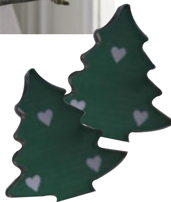
Foto linke Seite: Kranz: Rayher. Band: Halbach. Grüne Herzen, Zapfen: Gerda Hüscher. Eiskristalle: Grüne Erde. Silberne Herzen: Butlers. Foto oben: Backförmchen: bavendo.de. Windlichter: Ikea. Eichhörnchen: Schleich. Bezugsquellen Seite 118

Jedem seine griffbereite Pralinenration! Für liebe Gäste werden jeweils drei Pralinen auf Schaschlikstäbe gespießt, die mit Sternanis oder kleinen Zapfen – befestigt mit Sekundenkleber – verziert sind