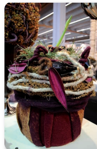
Fäden, Filze, Flocke von Lehnerwolle/OÖ

Lehner Wolle GmbH Kuefsteinweg 3 A-4730 Waizenkirchen Tel. 07277/2496 Fax 07277/2496 14 www.isolena.at