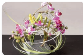
Kunstblumen von Botanic Haus/D

Kaum mehr von der Natur unterscheiden lassen sich die hochwertigen Kunstblumen von Botanic Haus, Crailsheim/D, insbesondere wenn sie gemeinsam mit natürlichen Materialien wie Stein, hochwertigem Granit und Cannastäben, veredelt in eleganten, formschönen Porzellan- und Glasvasen auftreten. Die edel reduzierten, von metallischen Spiralen umspielten Gestecke eignen sich für verschiedene Einrichtungszwecke genauso wie als originelle Geschenkidee.